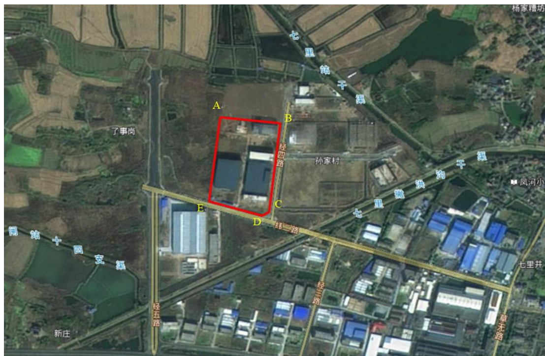
图 2.2-1 水土流失防治范围图